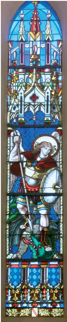
Vitrail de Lagor.