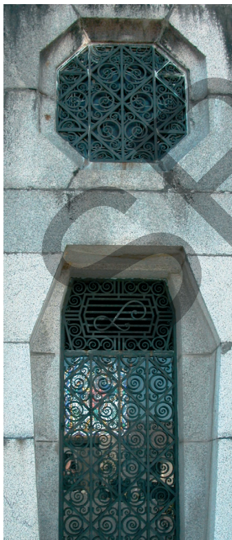
Caveau de la famille LAFONTAINE à Lagor.