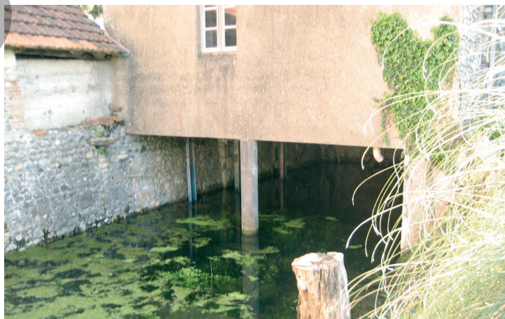
Moulin de Biron : boucau et canal de fuite