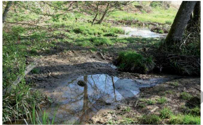
Mare de Cazaubin.