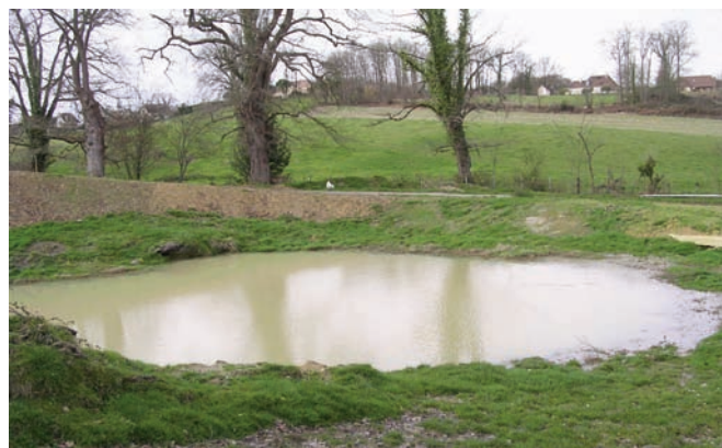
Mare de Bouché.