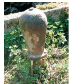
Tust : le béliér

Les signes ci-dessous indiquent des sites existants ou la situation de sites gravés dans la mémoire des habitants.