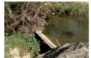
Lavoir de Tust