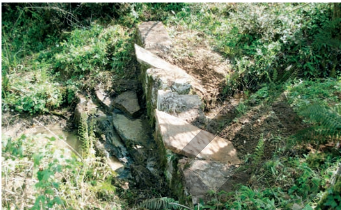
Lavoir Bouzoum à deux lauzes établi sur l'arriou Lestrémère près de sa source.

Plusieurs lavoirs étaient établis dans le lit des ruisseaux, quelques-uns en dessous du bassin de puisage d'une source. En principe, il était réservé au propriétaire, sauf accord avec le voisinage.