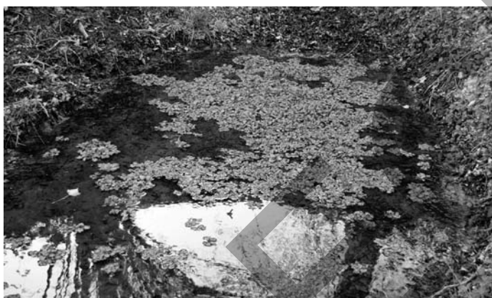
Source Lasserre, ayant un bon débit a sûrement décidé du centre du village.

Par la suite la distribution fut étendue à Ste Suzanne, Ozenx, Loubieng, Montestrucq, Laà-Mondrans et aux Marmonts un quartier d'Orthez !