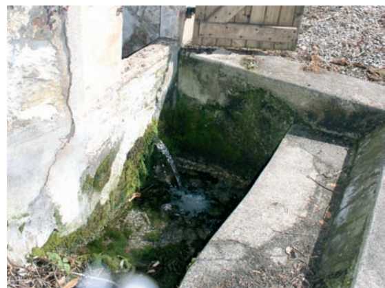
La Fontaine du Château.