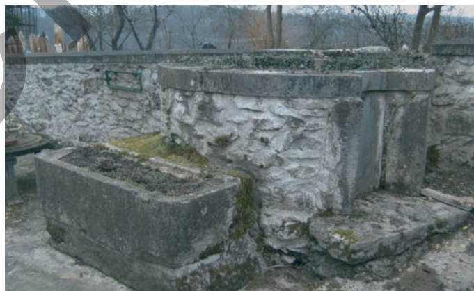
Abreuvoir à côté du puits.

La terre argileuse a permis aussi la création de mares.