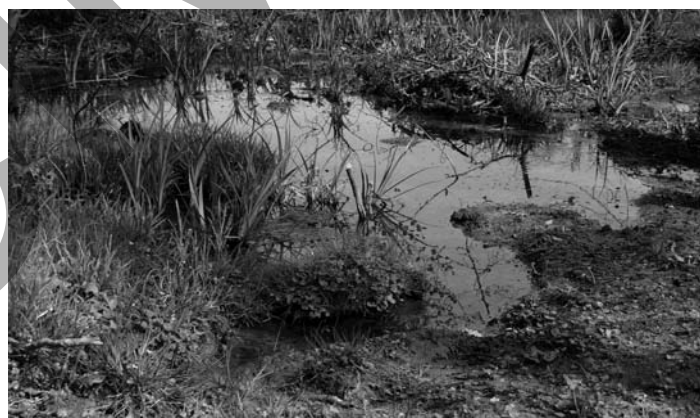
Source Cazaubin : le trop plein remplit une mare avant de renforcer l'arriou Lestrémère.