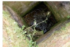
Source de Grêchez Regard sur le captage