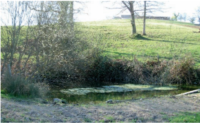
Mare de Lasserre.

Chaque maison de ferme en possédait une. La plupart sont comblées.