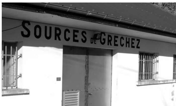
Station de pompage.