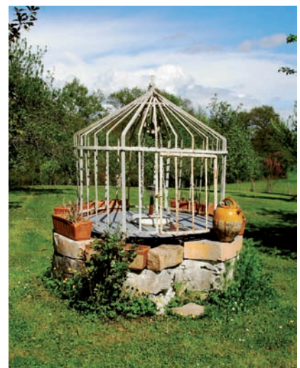
Merci aux familles Laulhé et Puharé. Maurice Rathier

Là comme ailleurs le puits a mis l'eau dans la cour. Après le puisage au seau vint la pompe aspirante à bras et enfin la moto-pompe. Sur 6 puits recensés 1 est utilisé pour le nettoyage agricole grâce à une moto-pompe.