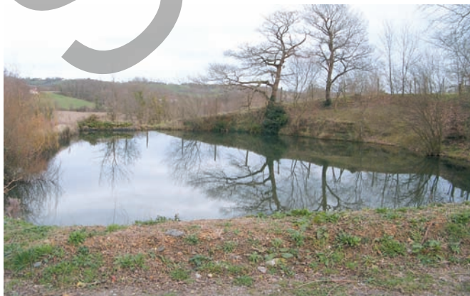
Mare de Tilh.

La terre argileuse a permis aussi la création de mares.