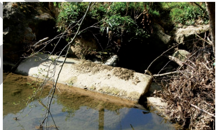
Tust le lavoir.