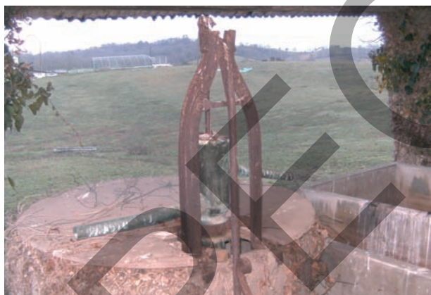
Puits à pompe.

L'eau était accessible en maints endroits et cette abondance a longtemps satisfait les besoins de sa population. Quelques étés trop secs et la pollution ont pourtant nécessité de trouver une autre forme d'approvisionnement. Une fois le réseau installé, sources, fontaines, lavoirs et puits ont perdu leur fréquentation et beaucoup, sans entretien sont en ruine ou ont disparu.