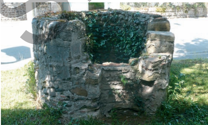
Le puit de Goarré.

La source du « petit bois de Lestapis ». Cette source jaillissait de terre dans un petit bois bordé de vieux arbres, au sol couvert de lierre. Elle communiquait ensuite par le biais d'un « trou d'eau » avec la Geüle. Des brochets remontaient par ces petits cours d'eau et venaient frayer dans le bois.