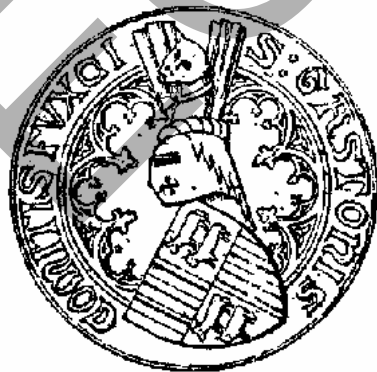
sceau de Gaston Fébus