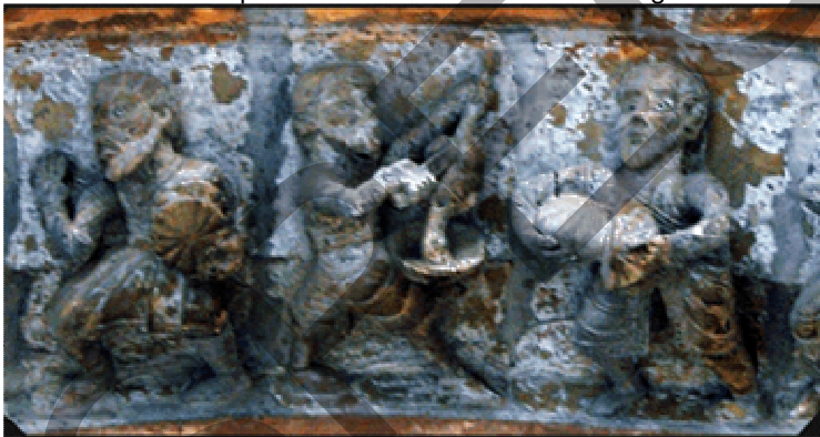
Ici, la saignée et le dépeçage du canard. Le moulage du fromage et son démoulage.

Le portail de la cathédrale d'Oloron est une bonne illustration de l'exploitation et de la transformation des produits de la culture et de l'élevage.