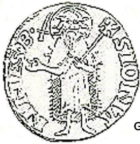
florin de Gaston Fébus

La plus ancienne monnaie du Béarn que l'on connaisse aujourd'hui, a été émise par les